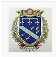
Armoiries complètes de Sevrans.