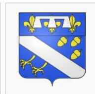
Armes de la ville

En 1964, la Ville a adopté des armoiries plus fournies qui font référence à l'histoire industrielle de la commune : flammes de la poudrerie et objectif de l'appareil photo en référence à Kodak.