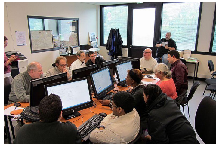
Participants à la journée contributive du 4 juin