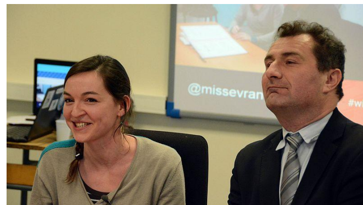
Signature de la convention de partenariat le 19 mars 2016