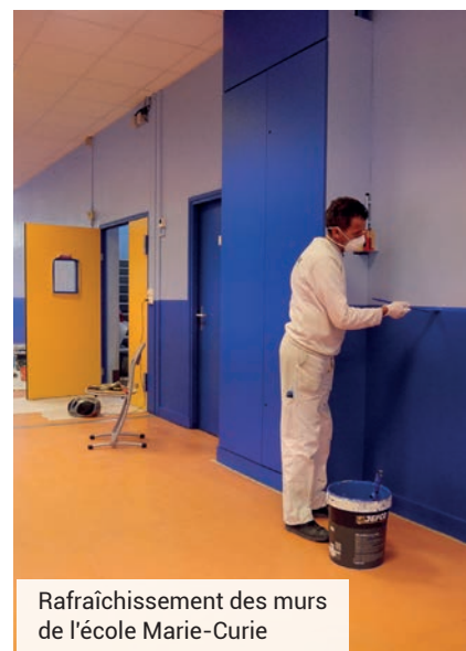
Rafraîchissement des murs de l'école Marie-Curie

Au-delà des travaux des écoles intramuros (nettoyage complet des accès et passages de circulation, réfection des sols, remplacements des châssis de fenêtres, et des remises en peinture), les services techniques ont effectué l'aménagement d'un parking enseignants à la