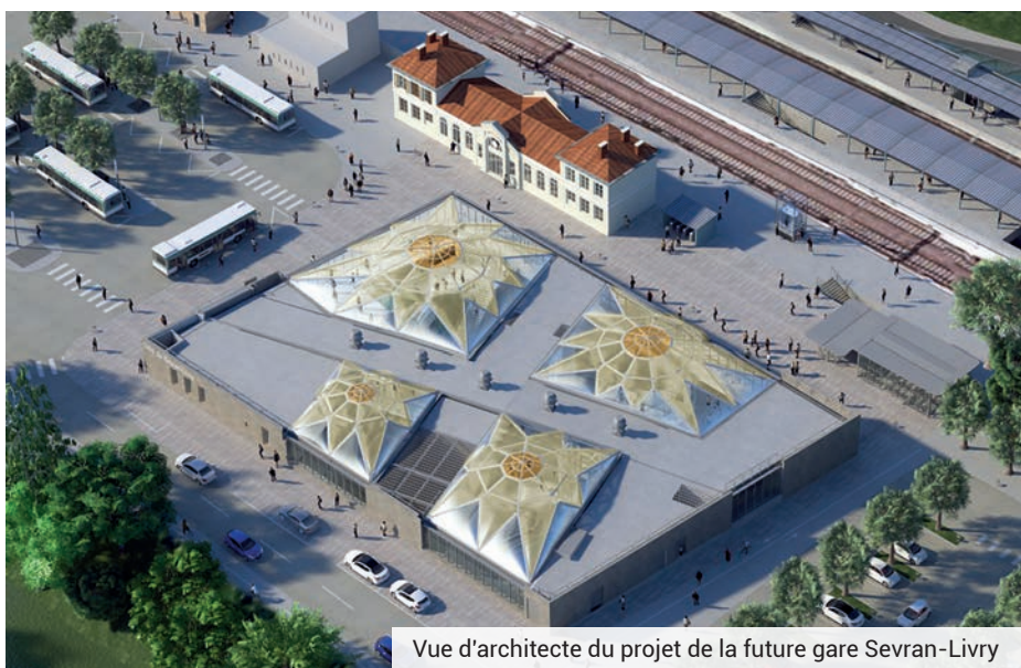
Vue d'architecte du projet de la future gare Sevrans-Livry