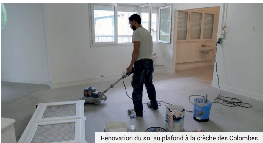
Rénovation du sol au plafond à la crèche des Colombes

maternelle Auguste-Crétier, la réfection du parvis du groupe scolaire Jean-Perrin et Claude-Bernard, ainsi que la reprise des affaissements dans la cour de l'élémentaire François-Villon.