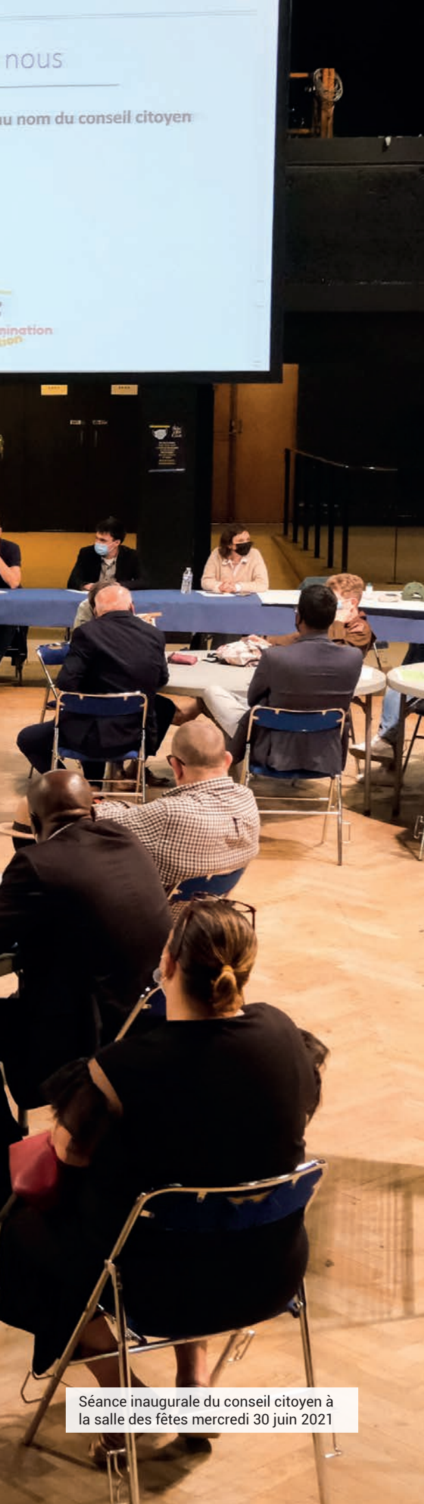
Séance inaugurale du conseil citoyen à la salle des fêtes mercredi 30 juin 2021