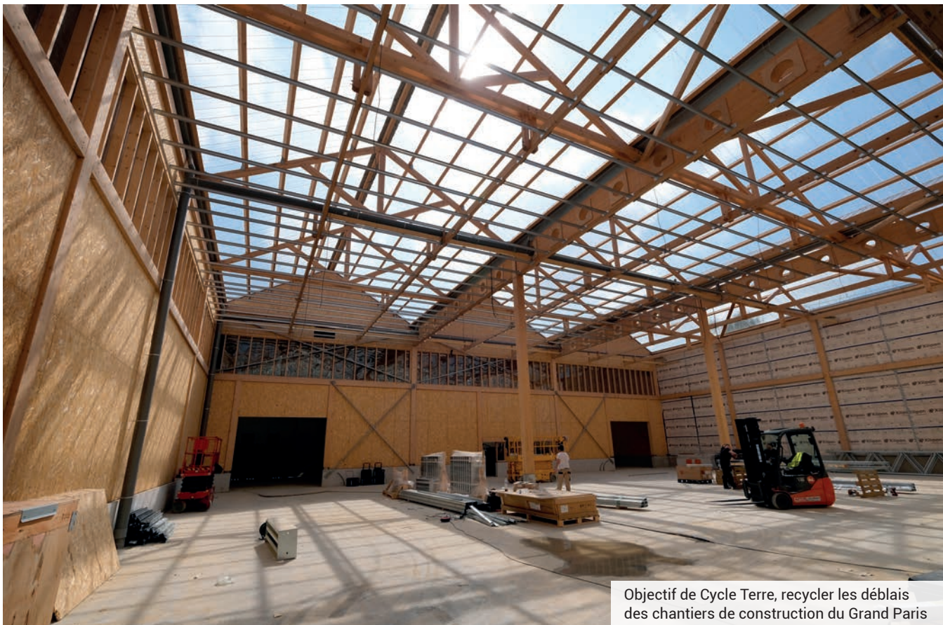
Objectif de Cycle Terre, recycler les déblais des chantiers de construction du Grand Paris

Dès cette rentrée, la Fabrique, installée dans la zone d'activités Bernard-Vergnaud, commencera à produire des matériaux de construction en terre crue issus des déblais des chantiers du Grand Paris.