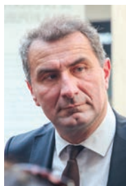
Stéphane Blanchet Maire de Sevrans