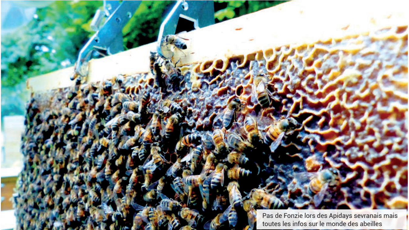
Pas de Fonzie lors des Apidays sevransais mais toutes les infos sur le monde des abeilles

Rendez-vous samedi 2 octobre de 9h à 17h30 sur le parvis du centre administratif Paul-Eluard pour la journée du développement durable à Sevrans. Au programme : animations, jeu de piste sur la qualité de l'air, ateliers d'extraction et de dégustation.