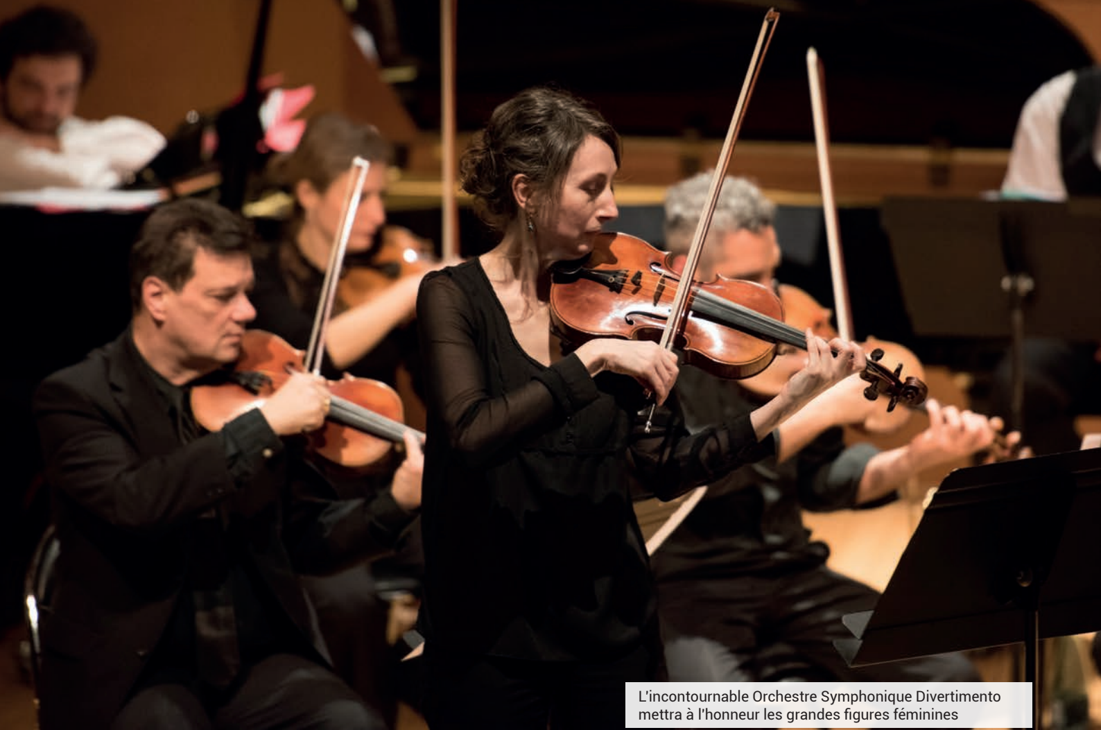
L'incontournable Orchestre Symphonique Divertimento mettra à l'honneur les grandes figures féminines