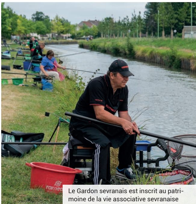
Le Gardon sevransais est inscrit au patrimoine de la vie associative sevransaise

Concours de la ville de Sevrans : inscriptions au 06 22 60 08 19