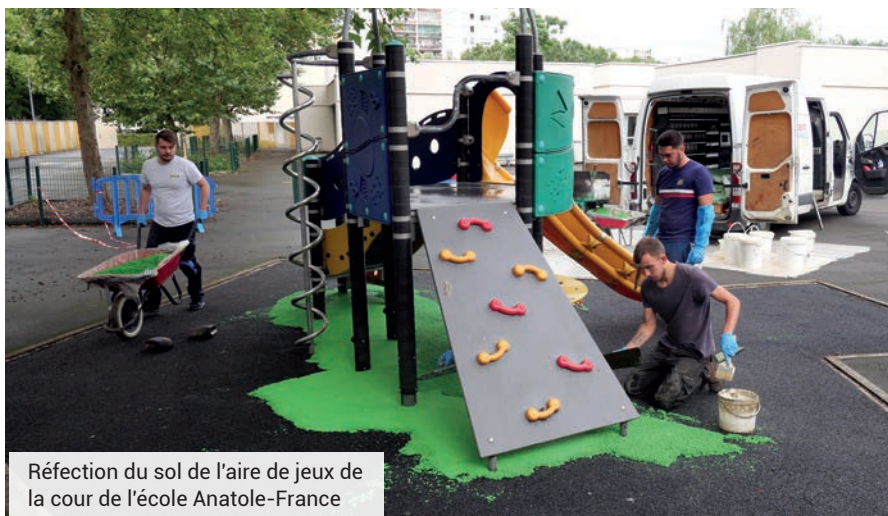
Réfection du sol de l'aire de jeux de la cour de l'école Anatole-France

Quand les enfants profitent des congés d'été pour se ressourcer, les agents de la ville donnent aux écoles et aux équipements un coup de neuf pour permettre, aux petits Sevrans, une rentrée dans les meilleures conditions. C'est notamment le cas sur l'école Lamartine où les grandes manœuvres ont débuté pour réhabiliter les anciens logements de fonction, afin d'agrandir l'école de six salles (de classe et de périscolaire) et d'aménager un réfectoire et une cantine au rez-de-chaussée. Cela permettra de mieux équilibrer les effectifs scolaires sur les trois écoles du quartier sud.