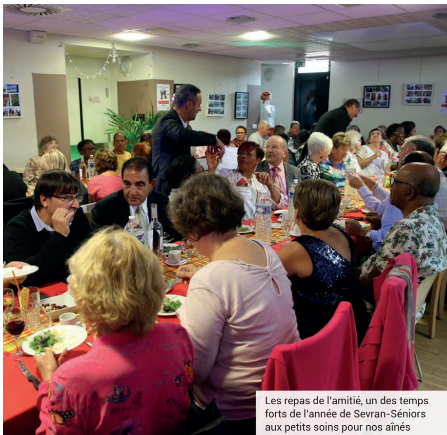
Les repas de l'amitié, un des temps forts de l'année de Sevrans-Séniors aux petits soins pour nos aînés

Renseignements : www.semaine-bleue.org Inscriptions : Sevrans-Séniors, 17, rue Lucien-Sampaix Tél. : 01 41 52 47 50