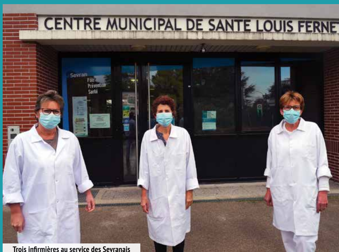
Trois infirmières au service des Sevransais