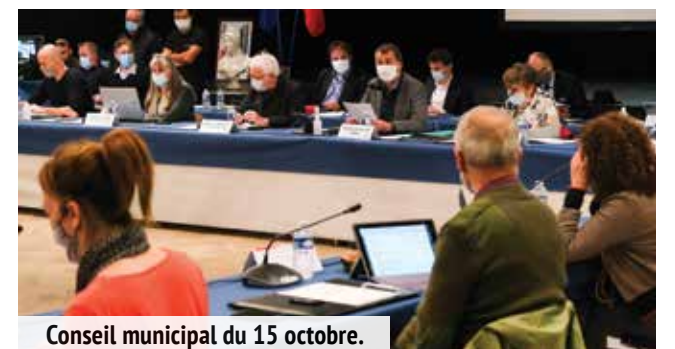
Conseil municipal du 15 octobre.

Une « fabrique solidaire » a même vu le jour avec une production de masques, faits par et pour les habitants. Au total, la crise a d'ailleurs déjà coûté à la ville plus de 3 millions d'euros pour assurer l'application des protocoles sanitaires afin de garantir aux Sevransais et Sevransaises la sécurité et la protection auxquels ils ont le droit.