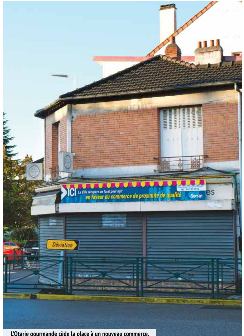
L'Otarie gourmande cède la place à un nouveau commerce.

(1) Direction du Service Économique, 1 rue Henri Becquerel, 93270 Sevrans.