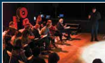
Citoyens au cœur de la cité > Page 7