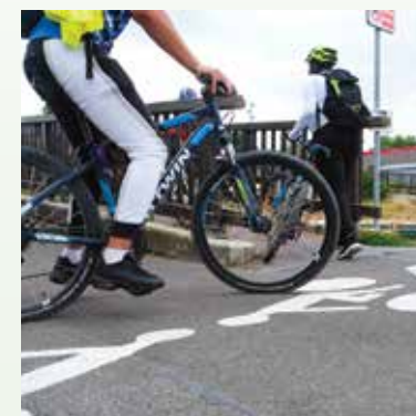
Piste cyclable du Canal de l'Ourcq.

un appel aux décideurs du département pour qu'ils nous aident à réaliser ce projet. C'est quelque chose qui se fait régulièrement aux Pays-Bas sur le circuit de Formule 1 de Zandvoort. Pourquoi pas chez nous ? La Seine-Saint-Denis et les cyclistes de Sevrans pourraient être précurseurs au moment où les Jeux olympiques de 2024 approchent de plus en plus... »