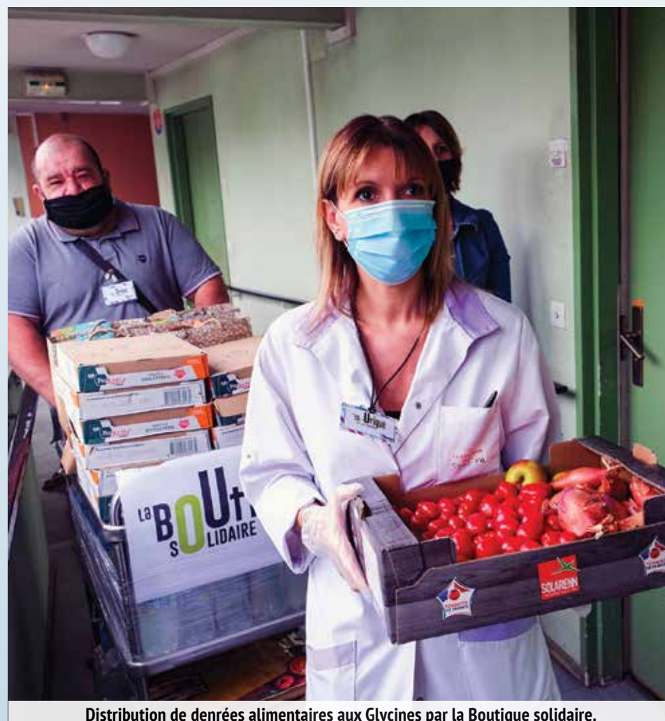
Distribution de denrées alimentaires aux Glycines par La Boutique solidaire.