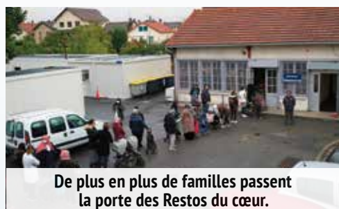
De plus en plus de familles passent la porte des Restos du cœur.