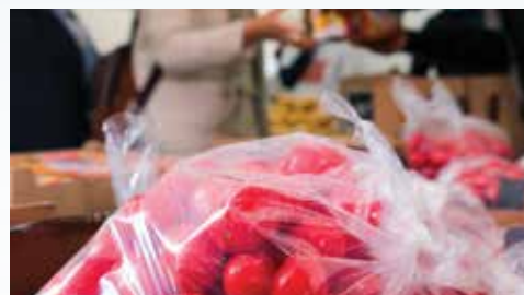
Distribution de denrées alimentaires à la Fabrique solidaire au printemps dernier.

L'attention portée aux Sevransais se prolonge par le soutien apporté à d'autres associations qui agissent sur le terrain de l'entraide et de la solidarité. Les assistantes sociales du CCAS orientent régulièrement des familles en difficultés vers la rue Le Maner. Sur demande de l'association, le CCAS peut également lui fournir des produits de première nécessité, comme elle le fait avec le Secours populaire français (SPF). La Ville est un précieux allié du SPF pour la mise en œuvre de ses actions