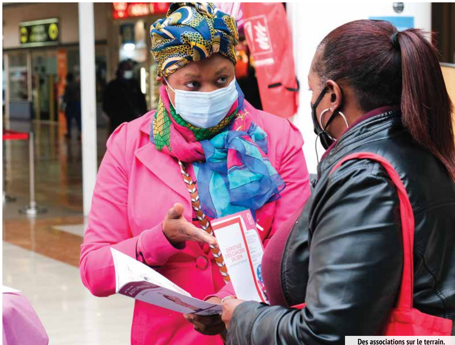
Des associations sur le terrain.

d'orgue le 17 octobre sur le marché. L'ensemble des acteurs de la santé et les associations participantes se sont rassemblés pour une ultime matinée d'échanges avec les riverains, en présence de la responsable départementale