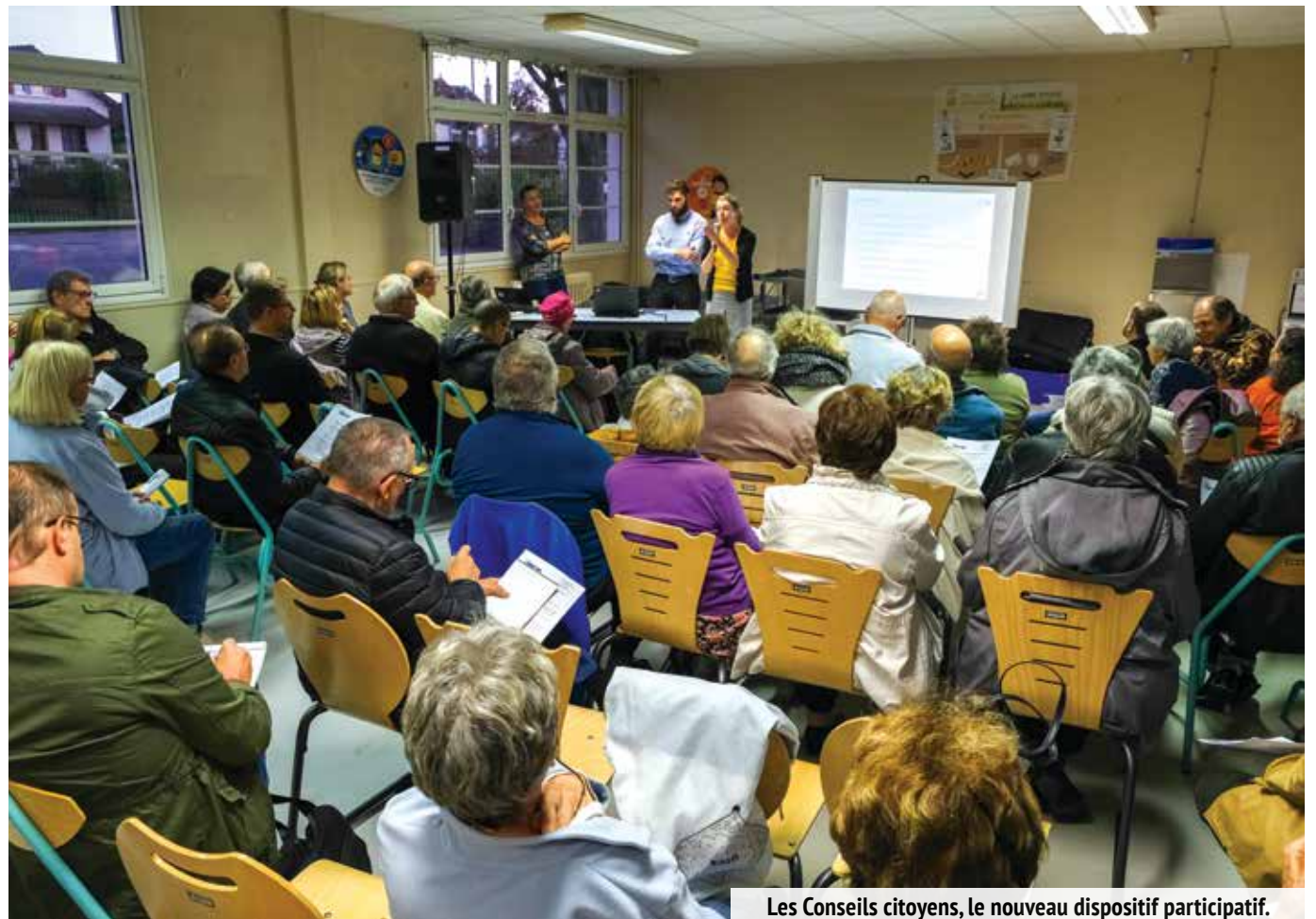
Les Conseils citoyens, le nouveau dispositif participatif.