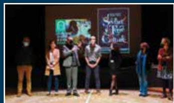
Théâtre de la Poudrerie : nouvelle étape > Page 4