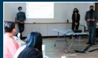
Engagé pour l'égalité femmes - hommes > Page 7