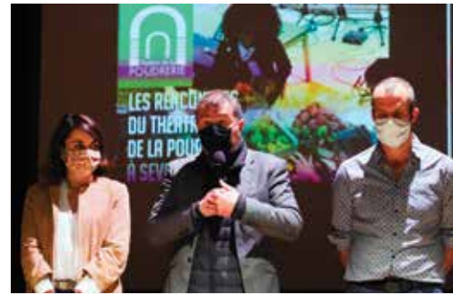
Les rencontres du Théâtre de la Poudrerie. Bruno Latour et le collectif « Où atterrir ? » ont proposé des débats participatifs.

Le Théâtre de la Poudrerie est la première scène conventionnée « Art en Territoire » d'Ile-de-France