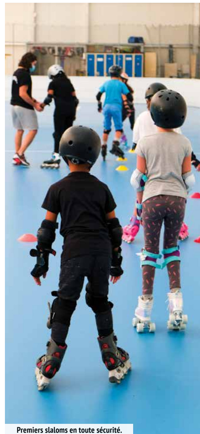
Premiers slaloms en toute sécurité.

Depuis la coupe du monde de football de 2019, le foot féminin a le vent en poupe ! A Sevrans, l'EMS vient de créer une section de foot 100 % féminin à destination des 7-12 ans. Il reste encore des places ! Si vous êtes intéressée, contactez le service des Sports au 01 41 52 45 60.