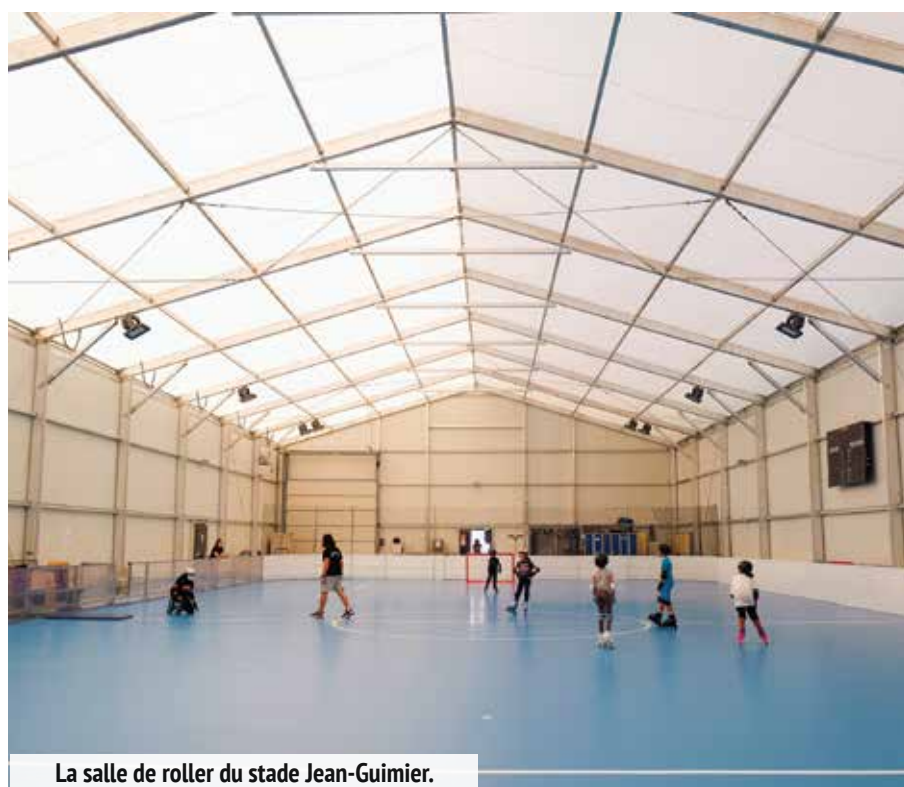
La salle de roller du stade Jean-Guimier.